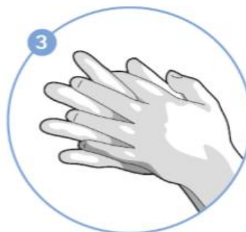
3. krok Dlaň na dlaň s roztaženými založenými prsty – mezi prsty.