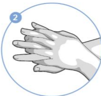
2. krok Pravá dlaň přes hřbet levé ruky, levá dlaň přes hřbet pravé ruky.