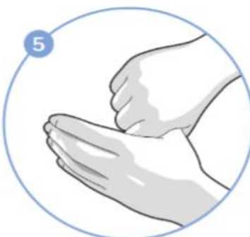
5. krok Krouživě mnout levý palec pravou zavřenou dlaní a naopak.