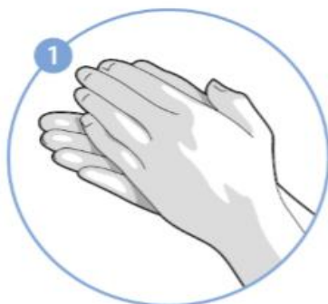
1. krok Dlaň na dlaň.