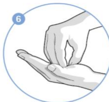
6. krok Krouživě mnout tam a zpět sevřené špičky prstů pravé ruky na levé dlani a naopak.